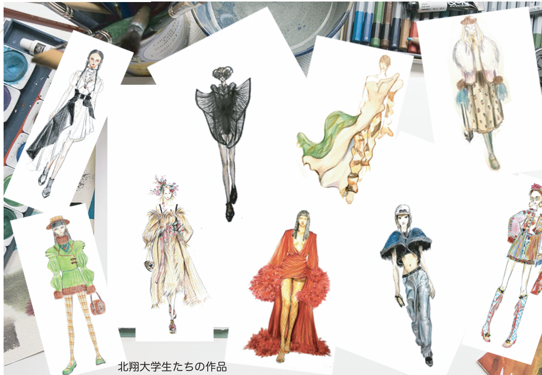
北翔大学生たちの作品